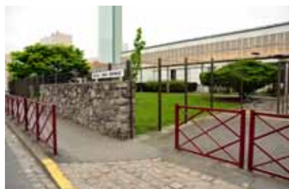
4 GYMNASSE JEAN-MERMOZ 50, rue Philibert Hoffmann Tél. : 01 45 28 10 25