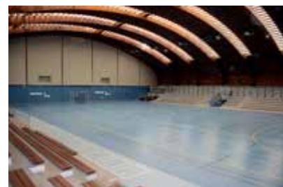
9 SALLE OMNISPORTS CLAUDE BERNARD 18 mail Jean-Pierre Timbaud Tél. : 01 49 35 38 10