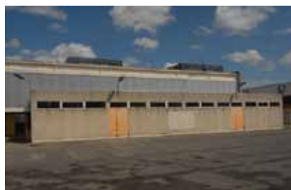
2 GYMNASSE DU PRÉ-GENTIL Rue Henri-Mondor Tél. : 01 48 94 59 58