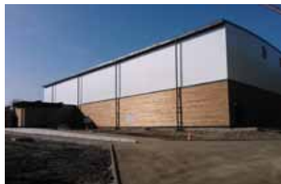
1 HALLE SPORTIVE Rue Conrad Adenauer Tél. : 01 45 28 18 72