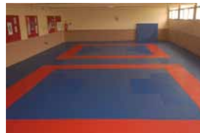
5 GYMNASSE ET DOJO LAVOISIER 46, rue Lavoisier Tél. : 01 48 94 59 64