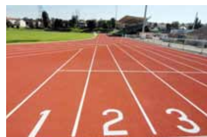
7 STADE ARMAND-GIRODIT 118, avenue du Président Kennedy Tél. : 01 45 28 03 06